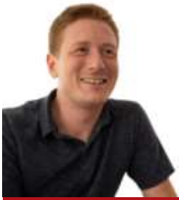
Renaud Giraldeau août 17, 2023

La députée de Laurentides-Labelle, Marie-Hélène Gaudreau se dit déçue par l'attitude irresponsable de Meta quant au blocage des contenus de nouvelles sur les plateformes que sont Facebook et Instagram. La députée rappelle que selon une récente étude, c'est environ 40% des Québécois qui ont pris l'habitude de consommer leurs nouvelles via les plateformes de médias sociaux. La députée lance donc un appel à la solidarité avec les médias locaux.